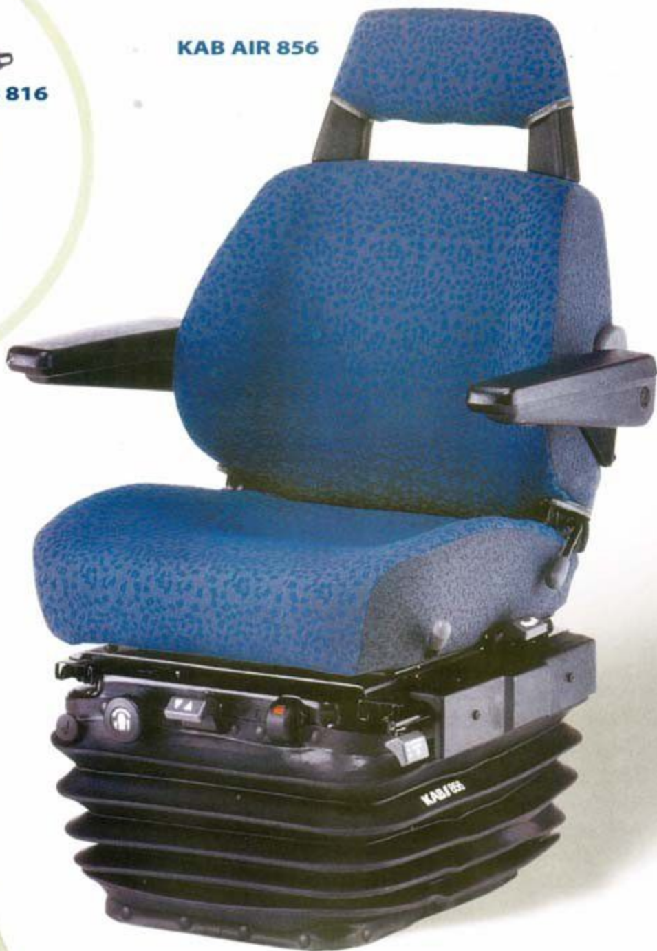
KAB AIR 856